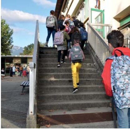
→ Le groupe scolaire Mi-Plaine, une fois entièrement rénové, offrira de bien meilleures conditions d'apprentissage pour les élèves et de travail pour les équipes enseignante et du périscolaire.