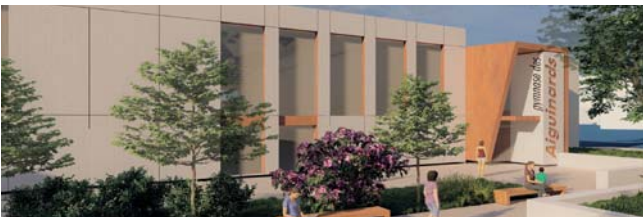
→ Les esquisses des projets.

Pour réaliser tous ces travaux avec la volonté de trouver des solutions pour réduire au maximum les impacts, une durée représentant deux années scolaires sera nécessaire.