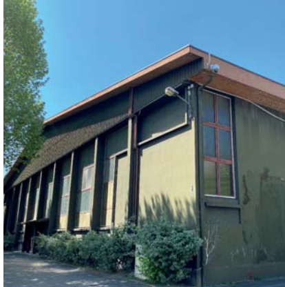
→ La rénovation du gymnase des Aiguinards débutera en septembre prochain.