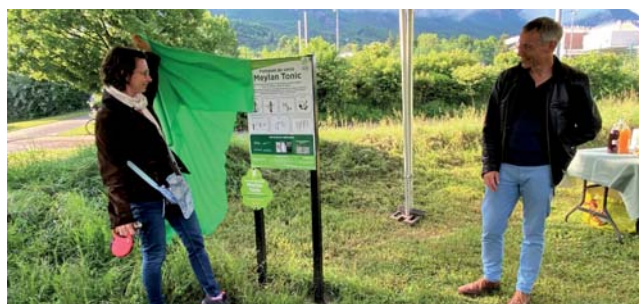
→ Le projet Meylan Tonic a été officiellement dévoilé le 15 mai dernier.