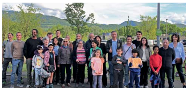
→ L'inauguration des havres de biodiversité et de la végétalisation de la cour des Chalendes a rassemblé de nombreux participants.

→ Retrouvez le règlement du 3 e budget participatif sur jeparticipative.meylan.fr