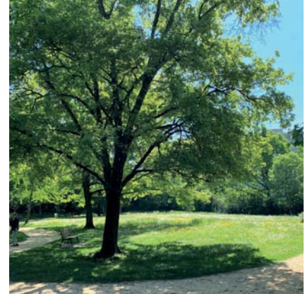
→ Amélioration des traversées piétonnes, aires de convivialité et de jeux, espaces sportifs, préservation de la biodiversité... les espaces du parc vont être réaménagés.