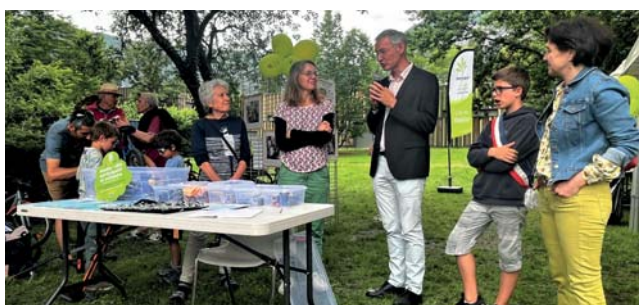
→ Bricolo Cycllette a organisé son 1er atelier participatif et solidaire de réparation de vélo le 29 mai dernier.