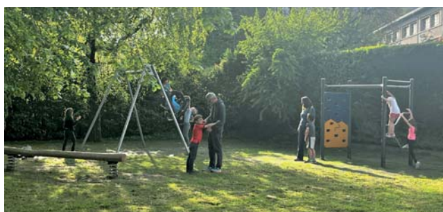
→ Le plateau sportif du Haut-Meylan comporte désormais de nouveaux jeux pour enfants.